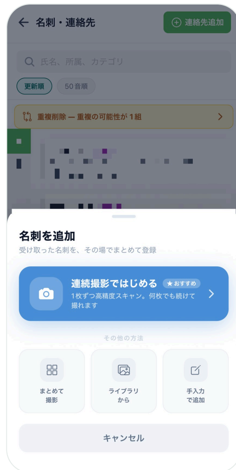
名刺・連絡先（連続撮影）