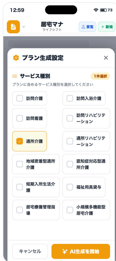
② 生成設定（サービス種別）