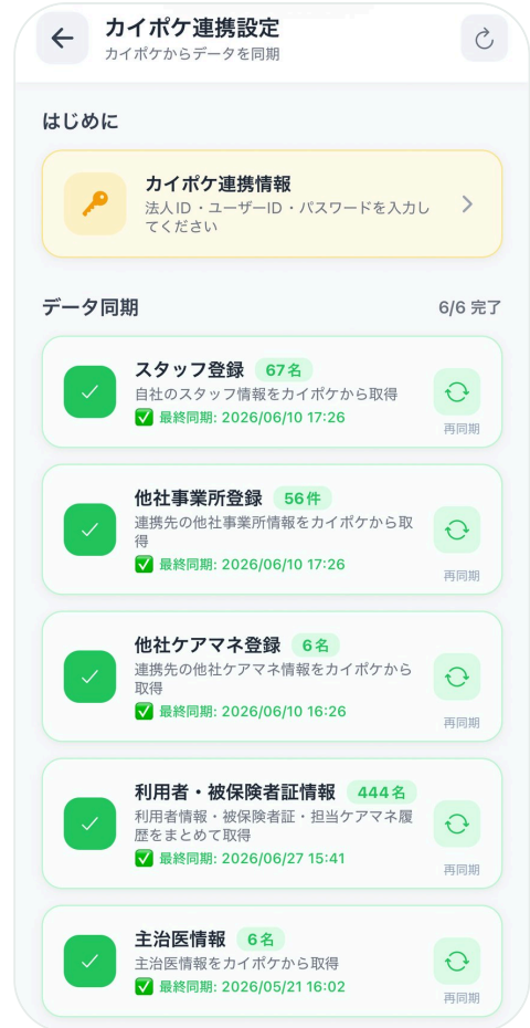
カイポケ連携設定（データ同期 6/6）

連携情報が未設定だと、同期も「RPA自動転記」（P.12）も動きません。最初に必ず設定を。