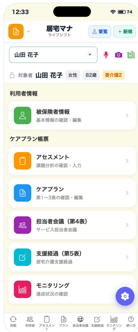
居宅マナ メニュー画面