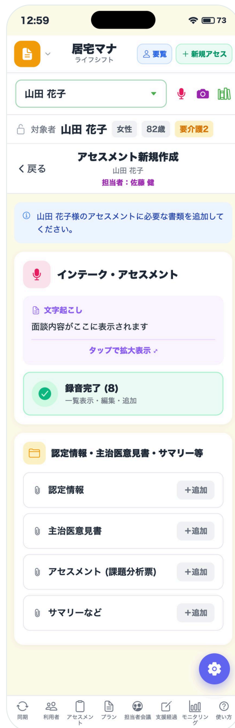
アセスメント（新規作成）